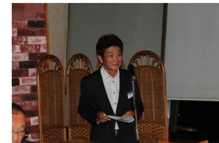
L臼杵PR・ゾーン委員