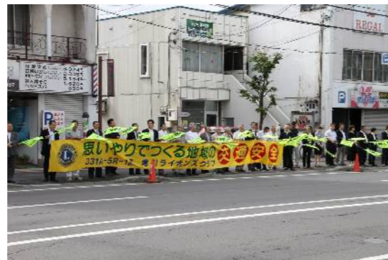
L水口会長もしっかり旗をかかげます