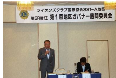
挨拶に立つL菊地ゾーンチェアパーソン