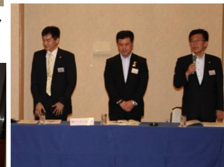
緊張の当クラブ三役