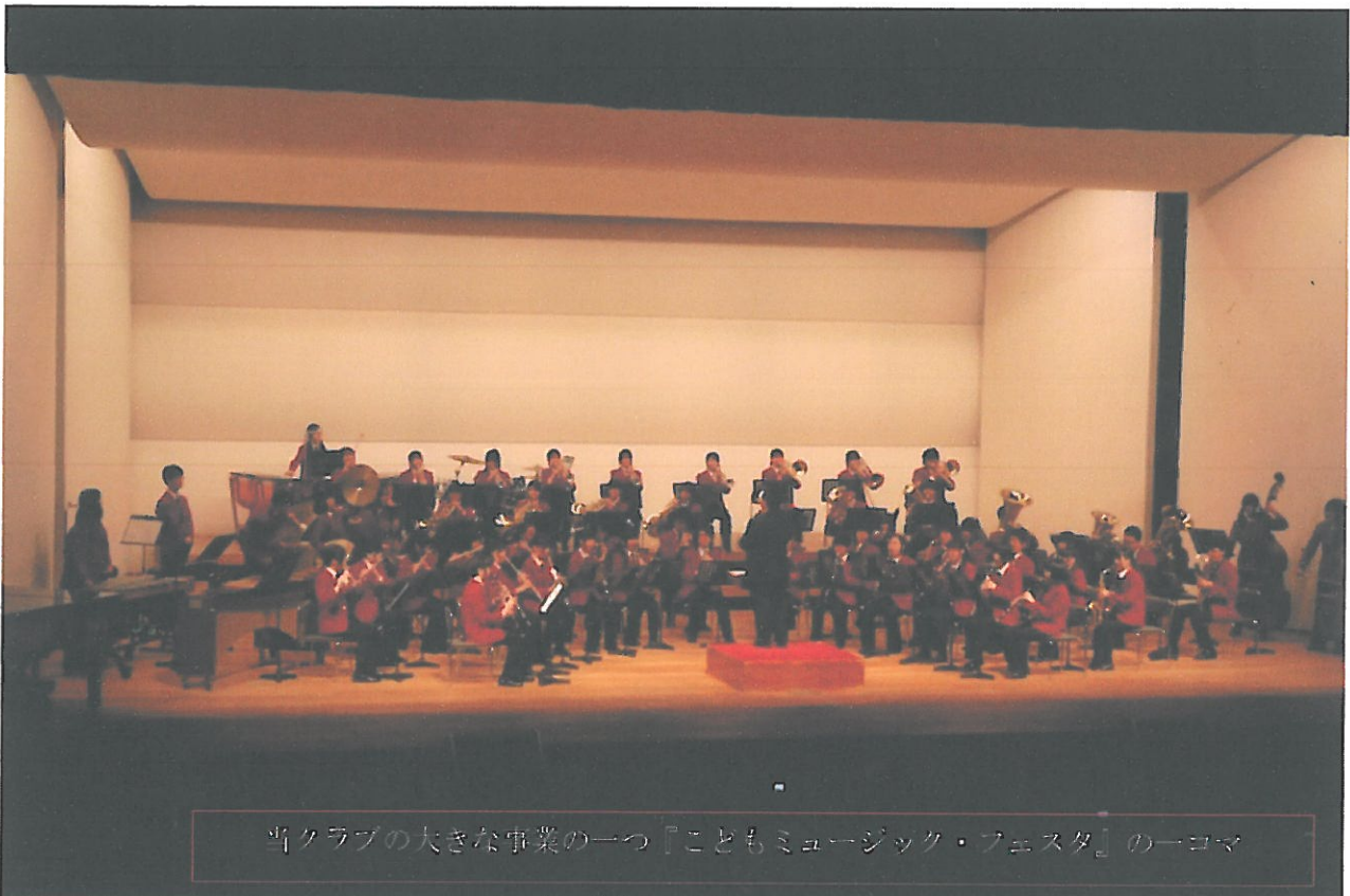
当クラブの大きな事業の一つ『こどもミュージック・フェスタ』の一コマ