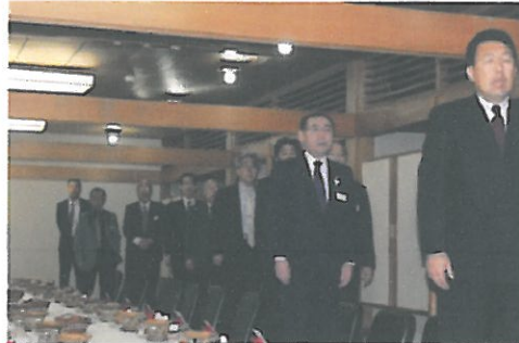
国歌斉唱並びにライオンズ・ヒム