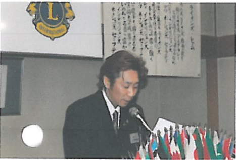
幹事報告 伊東会計