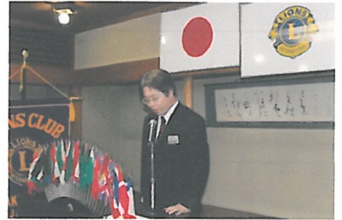
ライオンズの誓い L. 辰口