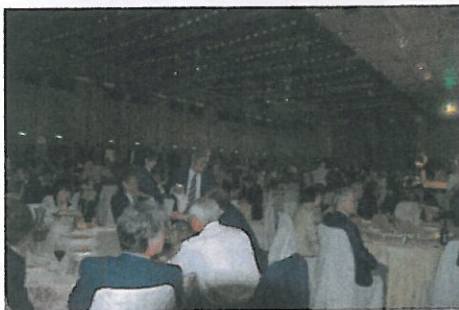
会場は盛り上がっていました