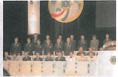
キャビネット役員