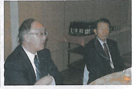
オイ焼酎水割り来ないぞ！！