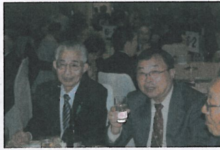
日本酒ですか？ 焼酎です