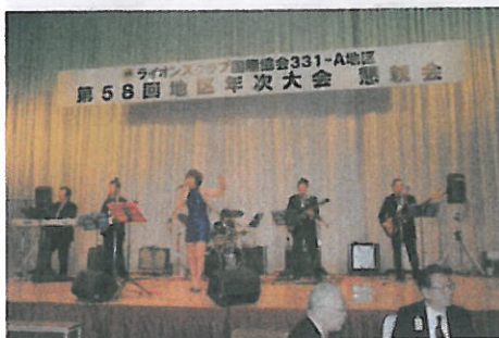
Tランナーズの方が・・・↑