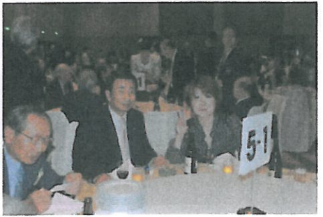
Vさん 来期は撮る役だよ〜ん