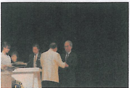
3つのアワードを頂きました