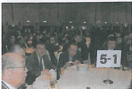
5年1組飲んべい集団