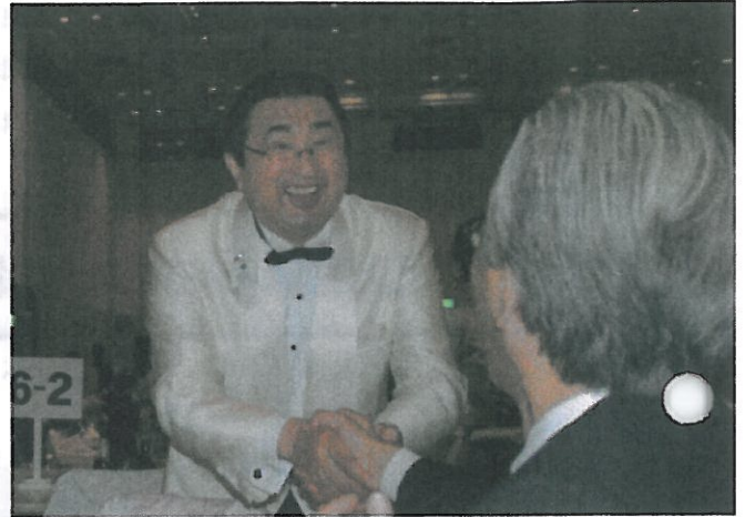
渡辺ガバナー・エレクト登場