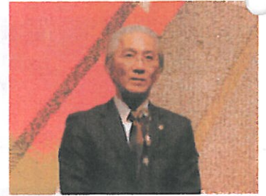
東日本大震災チャリティーの挨拶