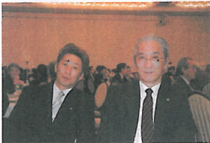
新3役セミナーにて