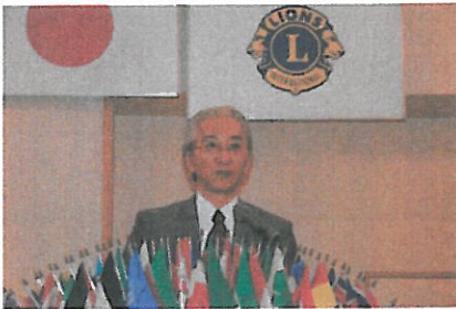
今期最後の会長挨拶

終わりに、滝川ライオンズクラブの益々の繁栄を祈念いたしまして退任の挨拶といたします。ありがとうございました。