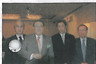
新3役セミナーにて