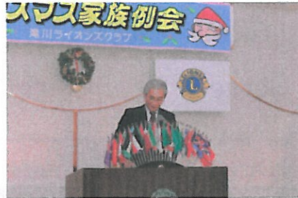
クリスマス家族例会挨拶