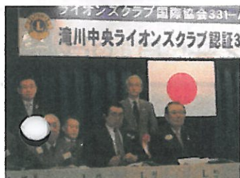
ライオンズ関係のご来賓