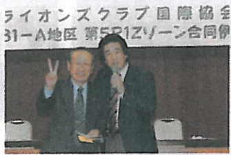
ゾーン合同例会にて