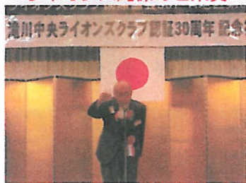
ウィ・サーブはL.近藤