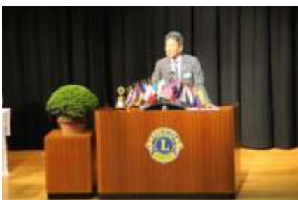
地区ガバナー 挨拶並びに活動方針