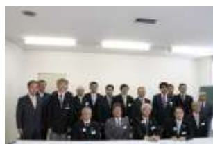
地区ガバナーと各クラブ幹事