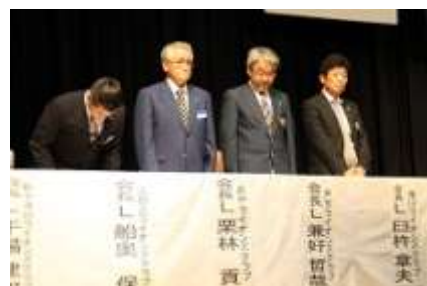
クラブ会長紹介の様子