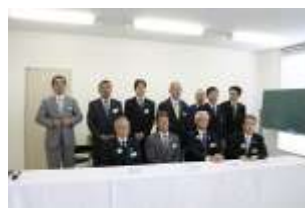
地区ガバナーと各クラブPR委員長