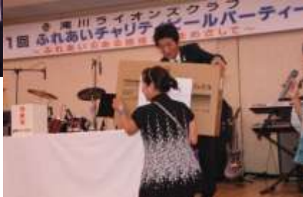
沢山様到来場頂きました。ありがとう御座います。