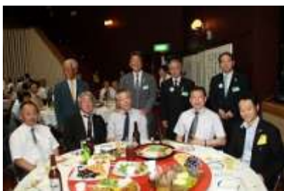
ガバナーと記念撮影