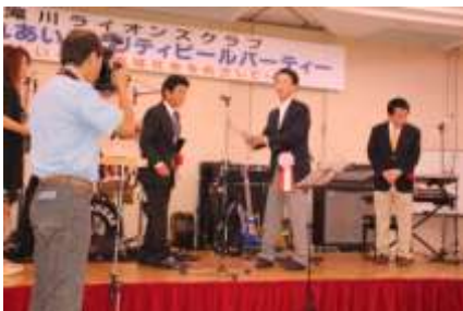
滝川市へ寄付金贈呈