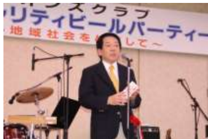
そらぶちキッズキャンプへ寄付金贈呈