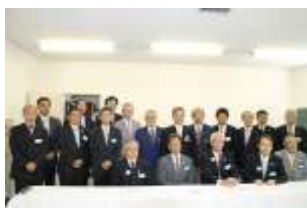
地区ガバナーと各クラブ会長