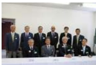
地区役員の方々です