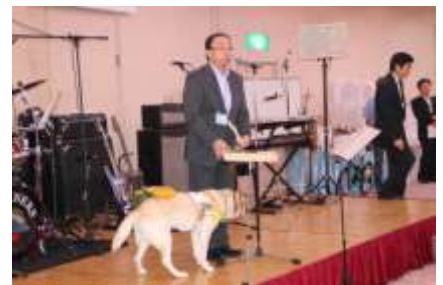
北海道盲導犬協会へ寄付金贈呈