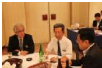
今季も頑張りましょう!