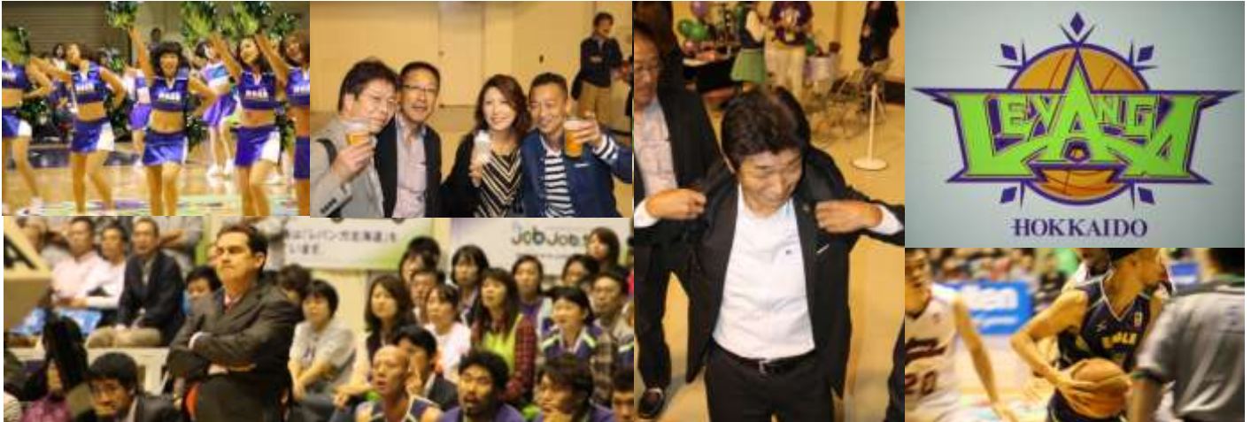
レバンガ北海道VS東芝ブレイブサンダース戦観戦

ジャスマックでは温泉にもつかり日ごろの仕事の疲れを癒しました。2日間の楽しいひと時を写真で報告させていただきます。