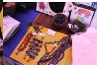
オリジナル商品も多数