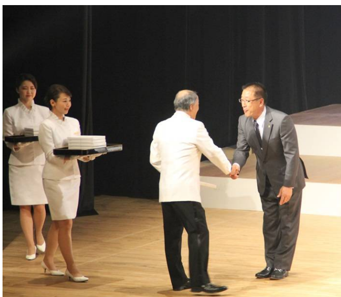
アワードを受けるL大石橋会長