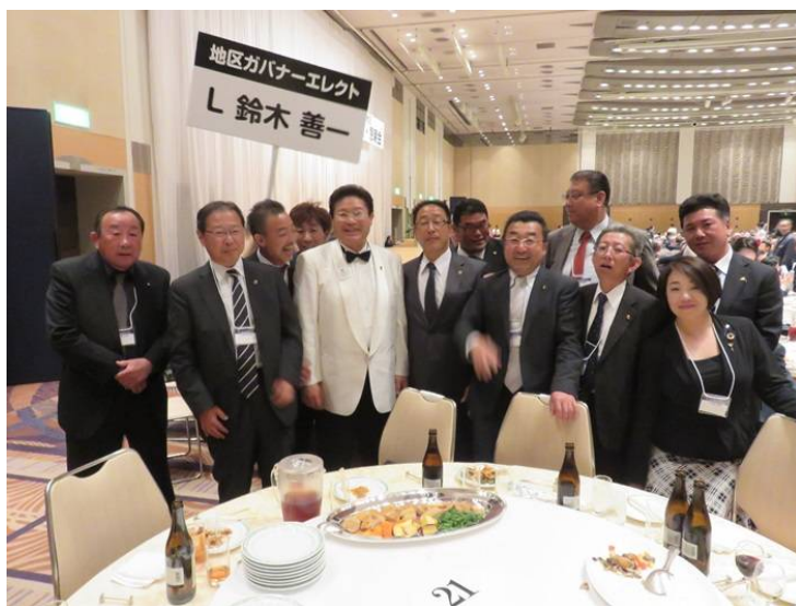
L鈴木次期ガバナーを囲んで