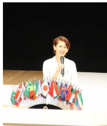
有森裕子氏の記念講演