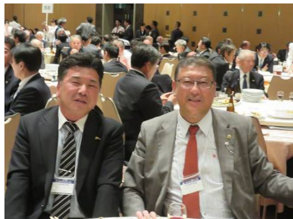
長い一日だったね