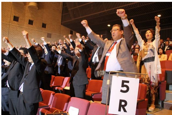
参加クラブのローア