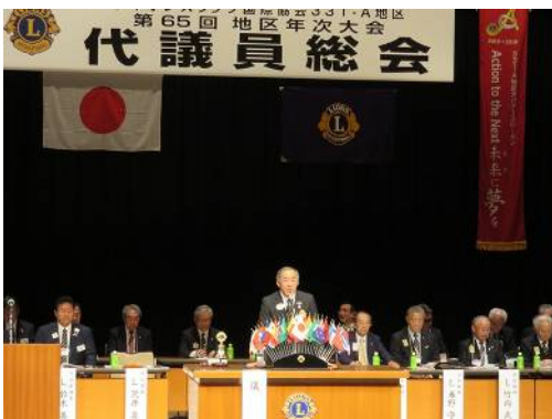
午前中の代議員総会からスタート