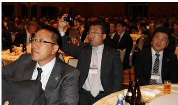
安堵の表情のL大石橋会長(左)