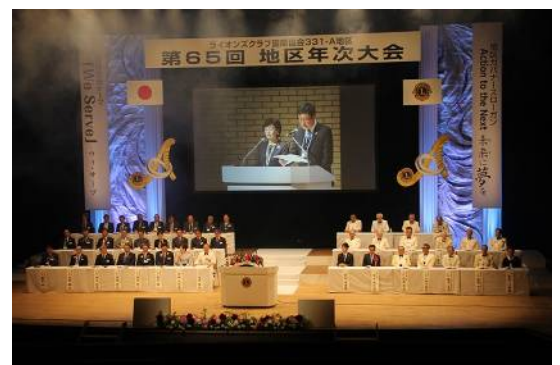
午後地区年次大会が始まりました