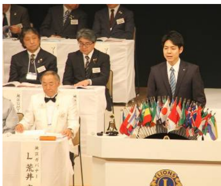
ご来賓の鈴木北海道知事