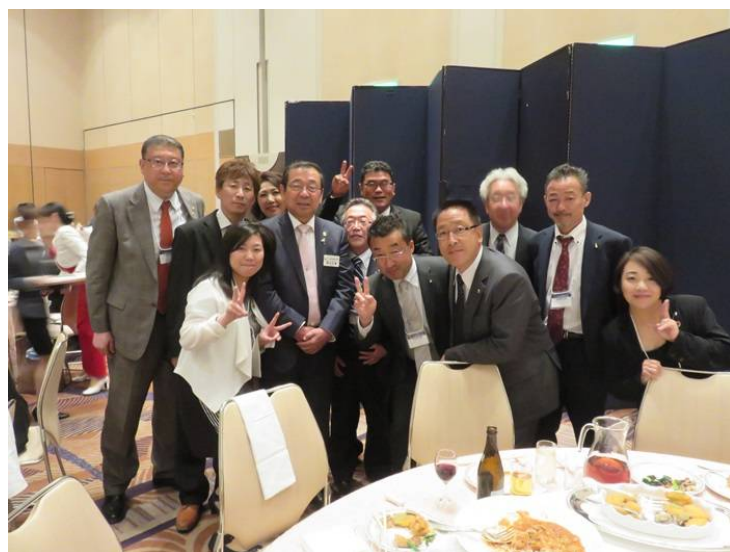
L植村ゾーンチェアパーソンを囲んで