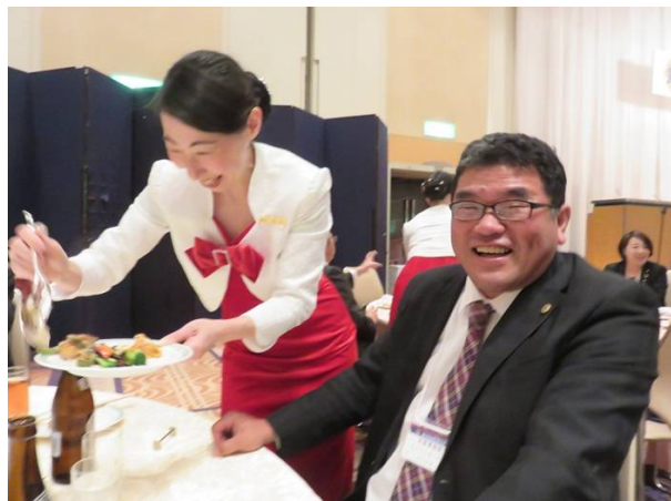
L玉手幹事もホッとした表情、でもまだあるよ。