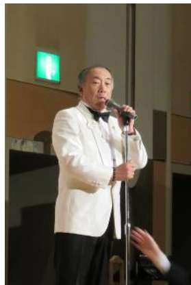
L荒井地区ガバナー