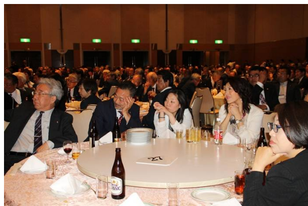
1年でアツと言う間だったね