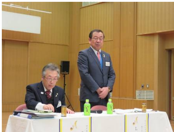
ごあいさつされるL植村ゾーンチェアパーソン