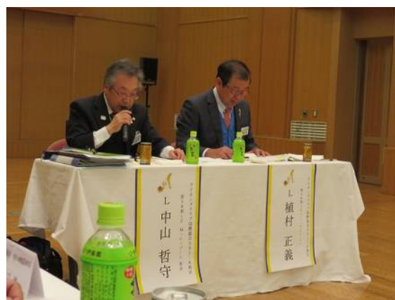
進行役のL中山MCゾーン委員