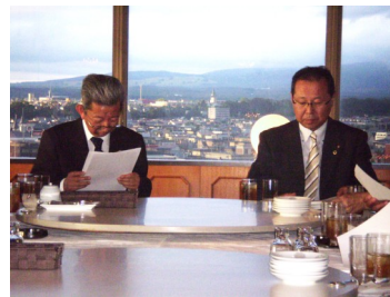
松浦会長（右）と中島幹事（左）で議事が進められ無事終了しました。