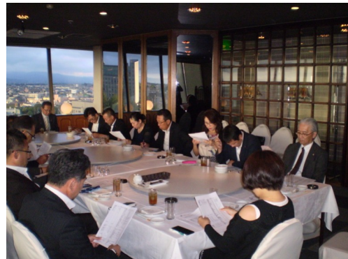
白熱した会議で一年の予定が打ち合わせされました。