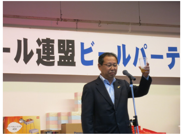
松浦会長は挨拶と乾杯を行いました