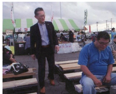
川瀬ライオンもかけつけてくれました。