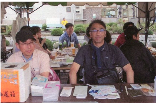
朴田ライオンも手伝いで