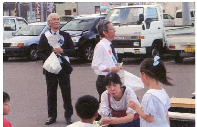
今年はちょっと人が少ないかな?