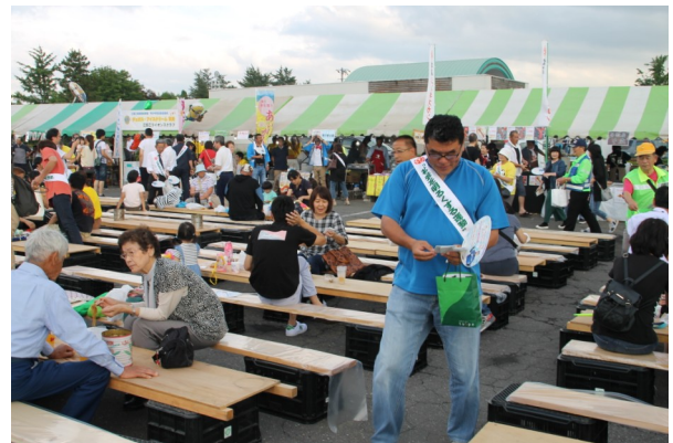
僕たちもビール飲みたい!!