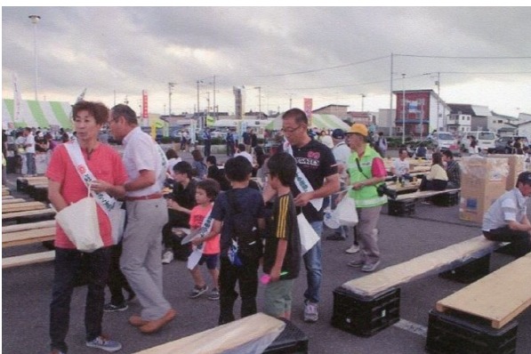
宣材を皆で配布しました