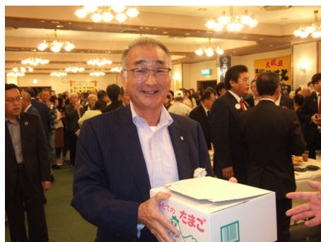
菊地ライオンは今年も賞品をゲット