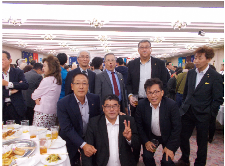
当日参加メンバーです