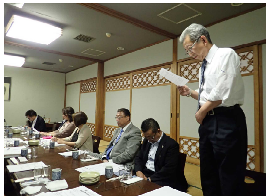
中島次期テールツイスターから本日の 会議の総評をいただき閉会となりました