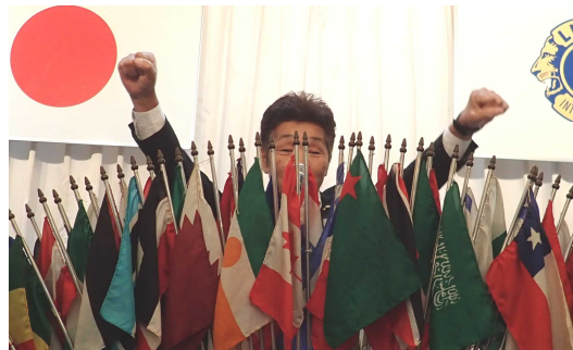
本日のローアは旗で隠れていますが臼杵ライオンです