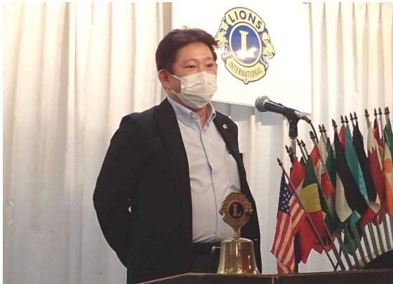
本日のメンバースピーチの講師は当クラブいちの律義な漢 内田ライオンのお話です