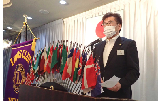
L水口幹事からの報告