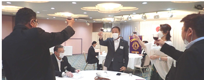
お祝いされるライオンはワインで We Serve!