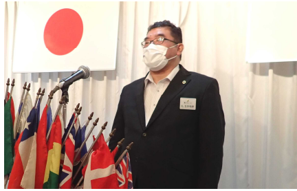
本日のライオンズの誓いは玉手第二副会長