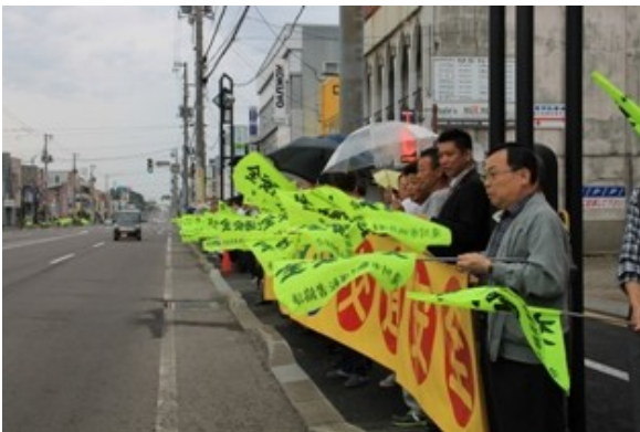
北洋銀行前交差点にて