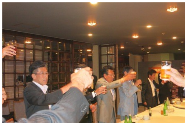
懇親会でウィ・サーブ