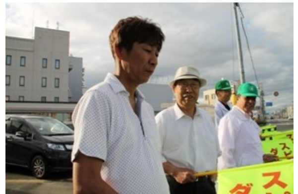
中央検問所前にて