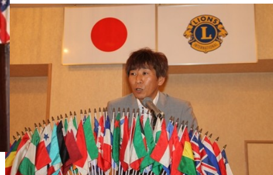
L.伊東の歓迎の言葉