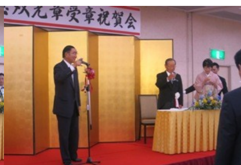
大河道議による祝杯