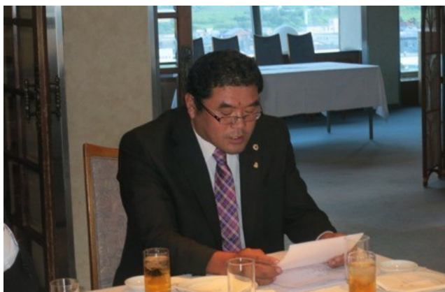
年間計画を発表する玉手計画委員長