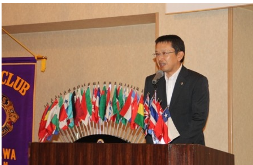
いよいよライオンとなったL.高桜の挨拶