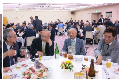
OBの顔も見られました。 皆さんお元気そうでした。